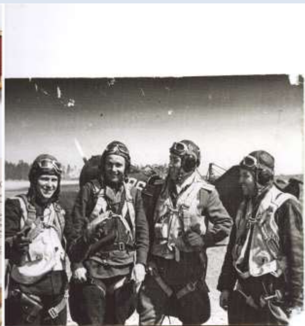
Пилоты-испытатели И.Т. Рыжов и другие в момент взлёта